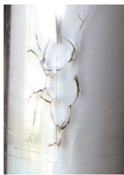
Haarrisse entstehen z.B. durch chemische Reinigungsmittel